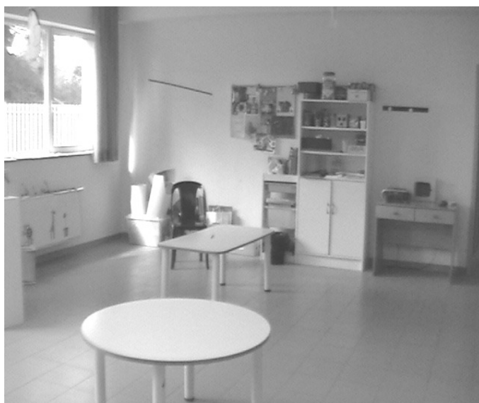
la nostra ludoteca

Il servizio garantisce, attraverso un'attenta organizzazione dei percorsi assistenziali, un'alta qualità delle cure secondo criteri di efficacia ed appropriatezza, assicurando rapidi tempi di risposta nel trattamento.