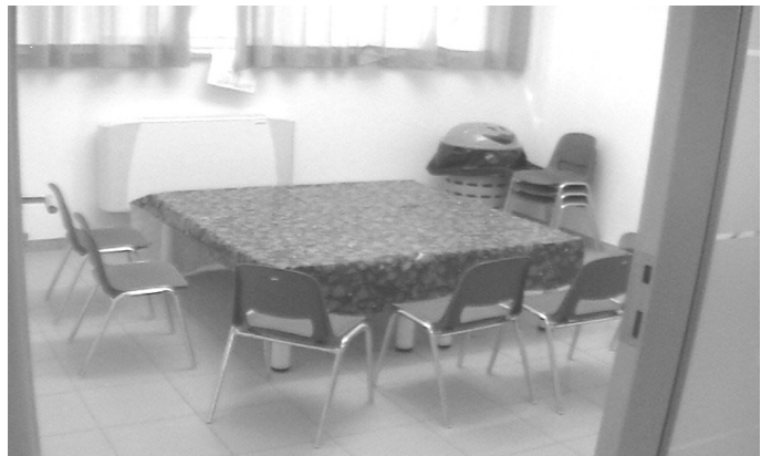
la sala pranzo