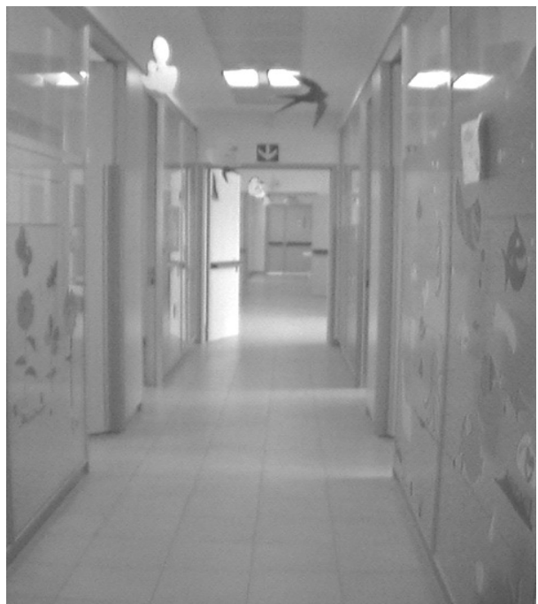
lungo il corridoio